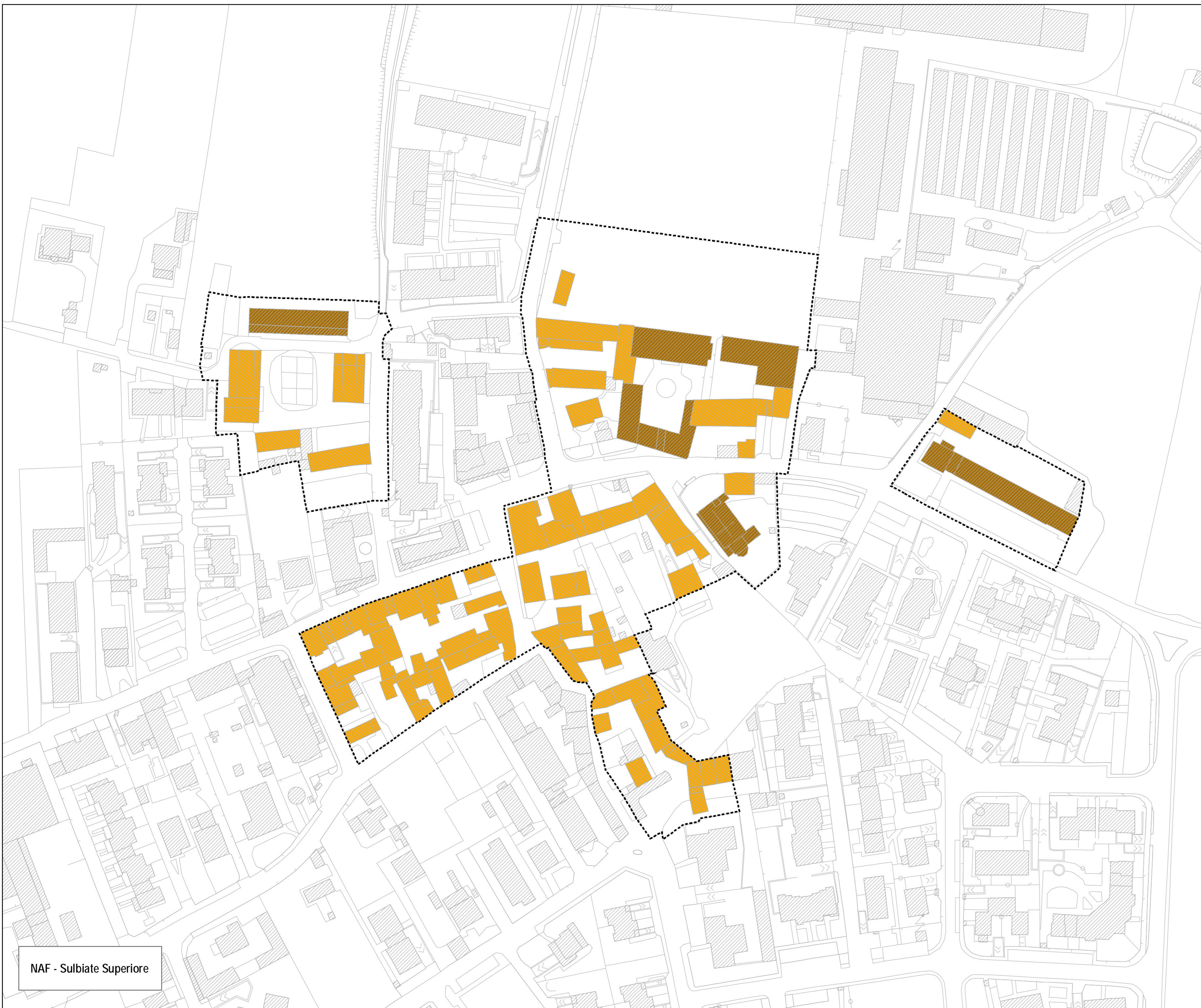
NAF - Sulbiate Superiore