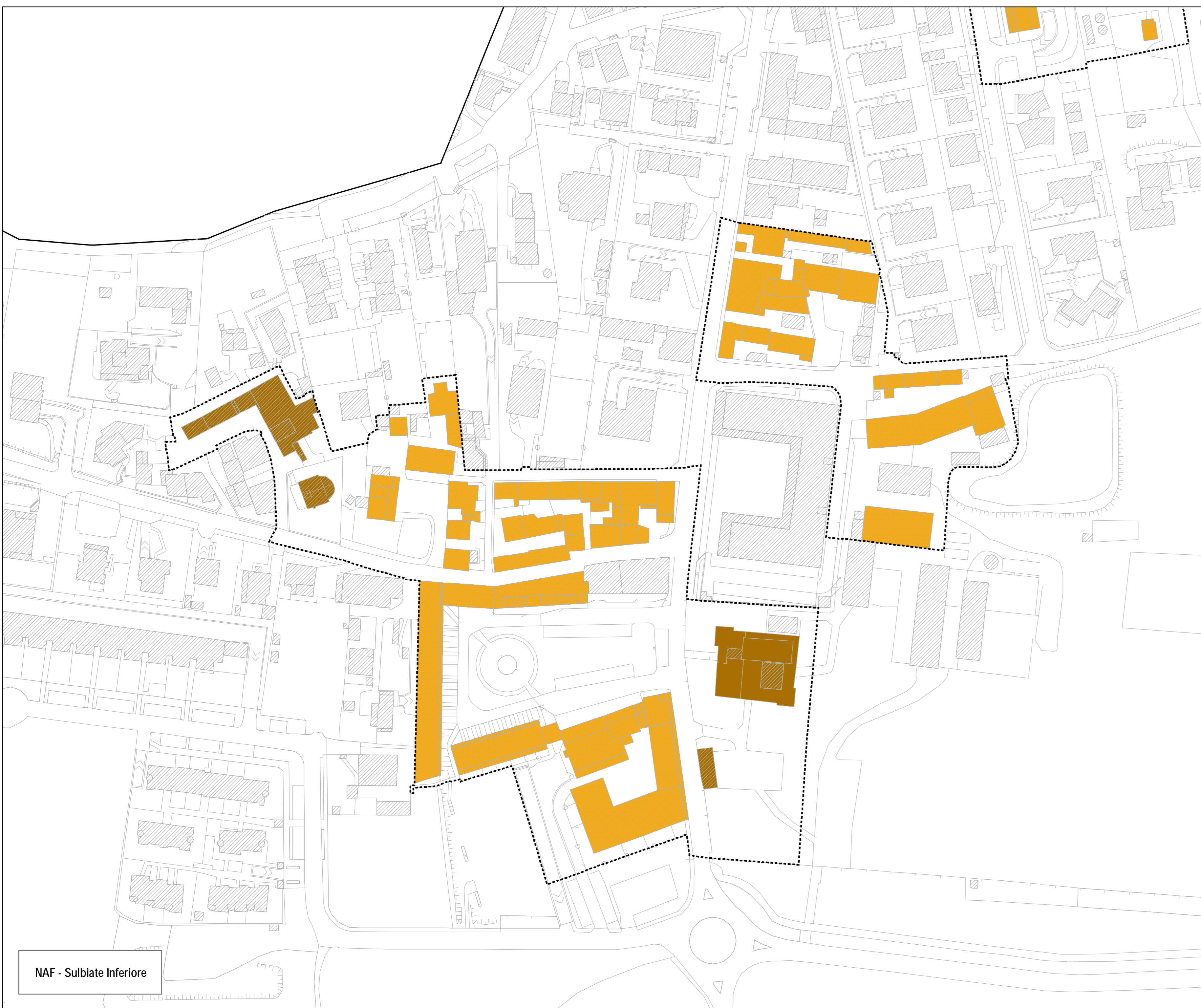
NAF - Sulbiate Inferiore